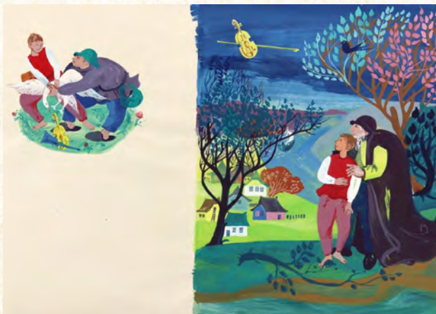
Buchillustration: Matthias und die Zaubergeige, 1963