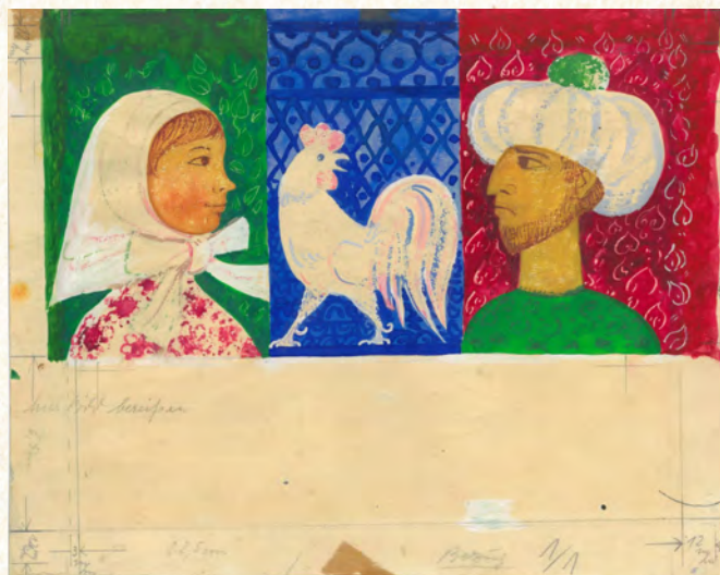
Buchillustration: Der Sultan und der weiße Hahn, 1963